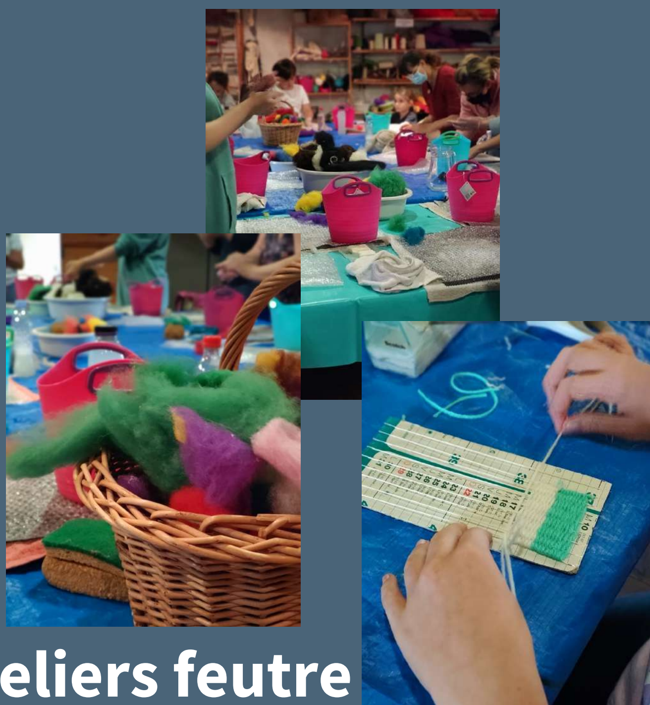
Ateliers feutre et tissage